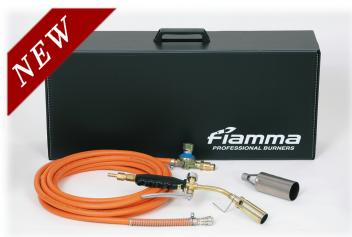
①ショートアームセット 火口φ30+火口φ50

Fiammaのガスバーナーは、豊富なアフターパーツ、製品保証 修理が可能な信頼のバーナーをご提供いたします。