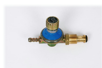
⑧R-155 専用レギュレータ

※アーム本体は直接ホースを挿して使用する事は出来ません。専用カップラーが必要になります。