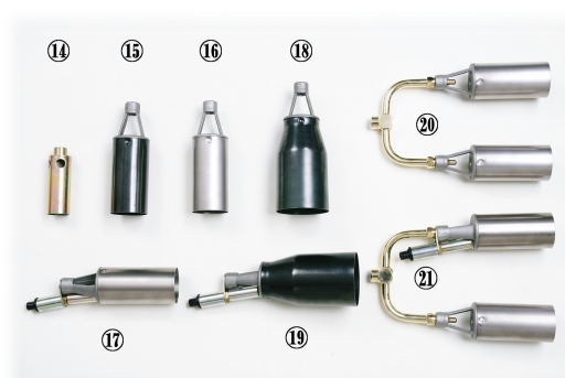
⑭ C-30 火口φ30 ⑮ C-50 火口φ50 ⑯ C-50T チタン火口φ50 ⑰ CL-50T チタン火口φ50着火付 ⑱ C-70 火口φ70 ⑲ CL-70 火口φ70着火付 ⑳ CW-50T チタン火口φ50×2 ㉑ CWL-50 チタン火口φ50×2着火付