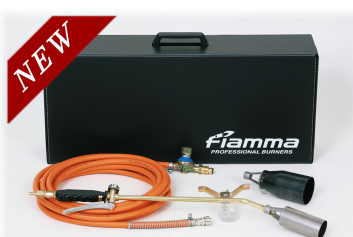
③ロングアームセット 火口φ50+火口φ70