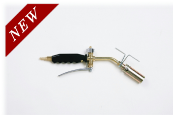
⑤SA-30 ショートアーム本体