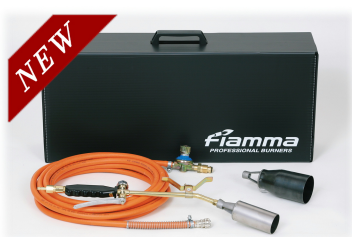
②レギュラーアームセット 火口φ50+火口φ70