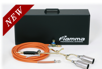
④レギュラーアームセット 火口φ50×2