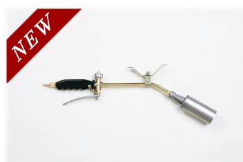
⑥MA-50 レギュラーアーム本体